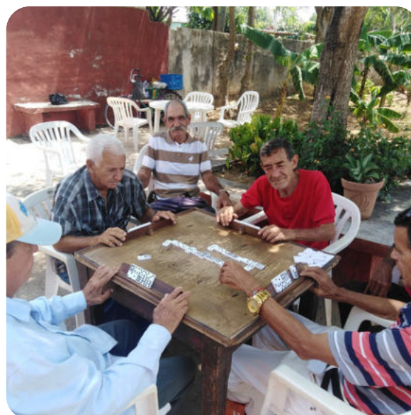
Die geistige Aktivität älterer Menschen durch Spiele fördern – eine der Aktivitäten in den Casas de abuelos

Seit 2018 wurde in der Stadt Colón im Zentrum der Provinz ein Projekt zugunsten älterer Menschen entwickelt. 3 Aus dieser Arbeit sind Protokolle und Leitfäden hervorgegangen, die heute nicht nur auf Provinzebene, sondern auch darüber hinaus als Referenz dienen. Dieses Projekt hat zu hervorragenden Ergebnissen geführt, und eine zweite Phase war geplant. Diese konnte jedoch insbesondere aufgrund der Auswirkungen der Pandemie nicht gestartet werden. Die Unterlagen zu dieser neuen Phase wurden uns kürzlich vorgelegt, und wir haben vereinbart, sie noch in diesem Jahr zu beginnen, sofern die finanziellen Mittel dafür zur Verfügung stehen. Diese Phase zielt insbesondere darauf ab, pflegende Angehörige sowohl durch technologische Hilfsmittel als auch durch die Bereitstellung praktischer Leitfäden zu unterstützen.