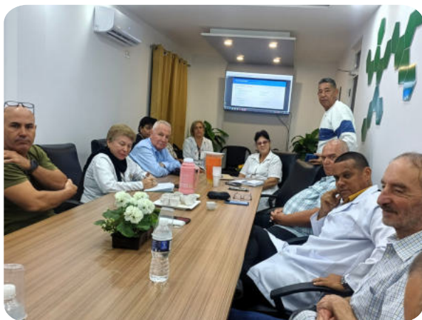
Treffen mit der Leitung des Krankenhauses Antonio Luaces Iraola: Diskussion über die aktuelle Situation und die Herausforderungen, die gemeinsam bewältigt werden müssen

Angesichts dieser Feststellung haben uns unsere Kolleg*innen ein Projekt zur Früherkennung von Krebserkrankungen des Verdauungstraktes durch Vorsorgeuntersuchungen vorgestellt. Obwohl dieser Vorschlag noch genauer ausgearbeitet werden muss, haben wir ihm grundsätzlich zugestimmt. Ausserdem wurde eine Zusammenarbeit mit dem Krankenhaus von Matanzas initiiert, um die Teams zu verstärken.