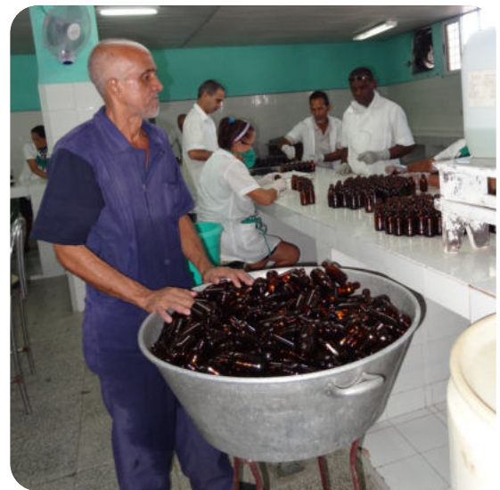
Dank der Umkehrosmoseanlage, die mCS vor 14 Jahren finanziert hat, können auch heute noch ohne externe Zufuhr gereinigtes Wasser für medizinische Labors und Infusionslösungen für die gesamte Provinz hergestellt werden © mediCuba-Suisse - Foto oben: November 2014 / unten: Januar 2026

Ein weiteres Bulletin wird sich mit dem laufenden Projekt „Cochlea-Implantate“ befassen, das mediCuba-Suisse seit mehreren Jahren finanziell unterstützt und von dem sich eines der Zentren in Santiago de Cuba befindet. Wir hatten dort die Gelegenheit, zwei Kinder mit Implantaten zu treffen und mit ihnen und ihren Müttern zu reden. Bei beiden Besuchen waren wir tief beeindruckt von der Professionalität der Teams, ihrem Engagement und den erzielten Ergebnissen, und dies trotz besonders schwieriger Bedingungen.