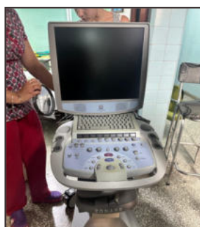
Die Ankunft der Ausrüstung in Containern ist für die Mitarbeitenden des Krankenhauses immer ein Grund zur Freude und Hoffnung

Der wichtigste Teil des Besuchs war dem Krankenhaus Faustino Pérez 4 gewidmet, wo die «Grupo Matanzas Suiza», die von mehreren Gesundheitsfachleuten aus der Ostschweiz geleitet wird, einen wichtigen Beitrag geleistet hat. Dieser Beitrag umfasste die Lieferung von medizinischem Material in Containern – bis heute elf! – sowie Schulungs- und Begleitmassnahmen zur Einführung, Entwicklung und Wiedergewinnung von Techniken und Technologien.