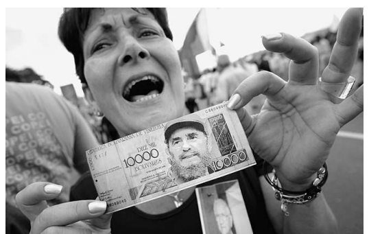
Castros Gesicht auf venezolanischem Geld

Der venezolanische Präsident setzt dagegen stärker auf die „Südamerikanische Gemeinschaft der Nationen“. Beim Gründungsgipfel im peruanischen Cuzco hatte Chávez die neue Organisation auf seine lyrische Art als Zug des Fortschritts gefeiert. Dabei fügte er die Politik als Lokomotive, das Soziale als Banner, die Wirtschaft als das Gleis und die Kultur als Brennstoff. Von Caracas wurden zugleich zahlreiche Initiativen gestartet, die sich zu einem strategischen Bündnis mit Kuba fügen, das